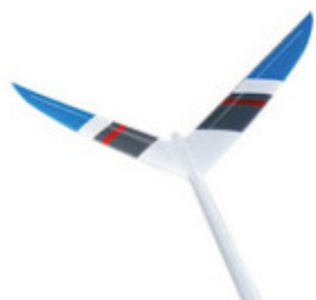
Motýlkové uspořádání OP

Motýlkové ocasní plochy se nasouvají na uhlíkovou spojku. Kormidla mají páky kormidel uvnitř v trupu, ocasní plochy jsou proto aerodynamicky naprosto čisté.